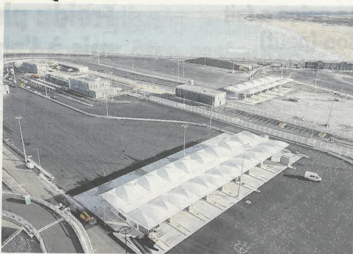
Premier port de France sur le fret routier, l'infrastructure de Calais appartient à la Région Hauts-de-France.

Avec un pic à plus de 600 en octobre, c'est l'effectif moyen sur site depuis reprise post confinement (mai 2020).