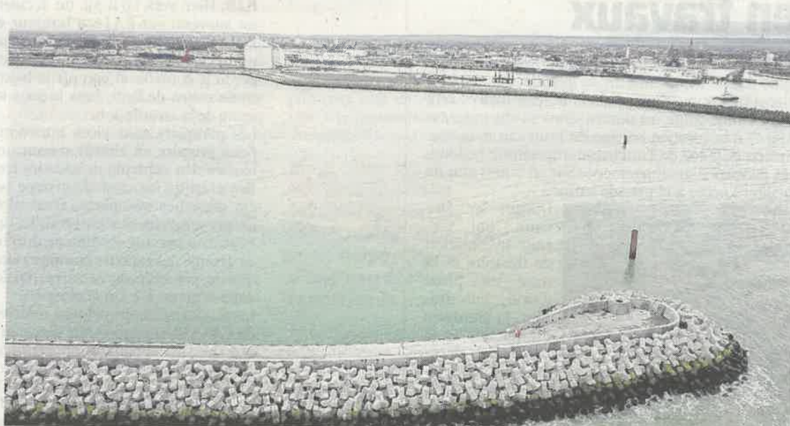
Le « chantier du siècle » a démarré en novembre 2015. Il sera livré en mai et entrera en fonction en octobre.