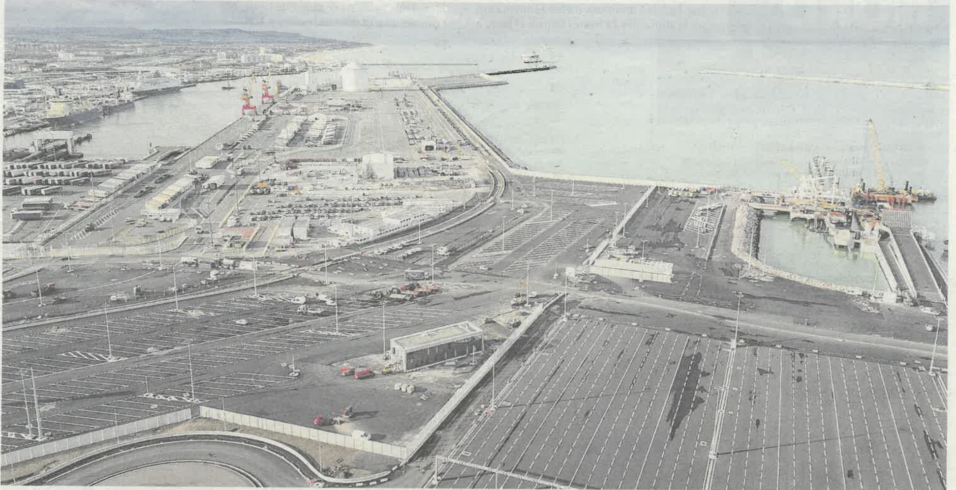
Le port de Calais va pouvoir accueillir plus de bateaux dont des ferries de plus grande ampleur et hybrides.