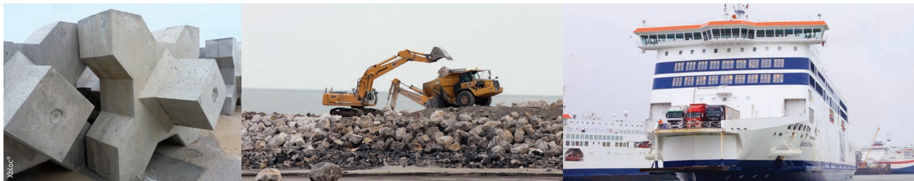
Le Xbloc® est un bloc en béton d'une grande fiabilité dans la structure des digues. Il sera l'élément emblématique du chantier. D'un design très étudié, les Xblocs® utilisés sur le chantier pourront atteindre près de 4 mètres de haut.